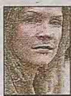
Åsne Seierstad är förvånad över bokhandlarens planer.