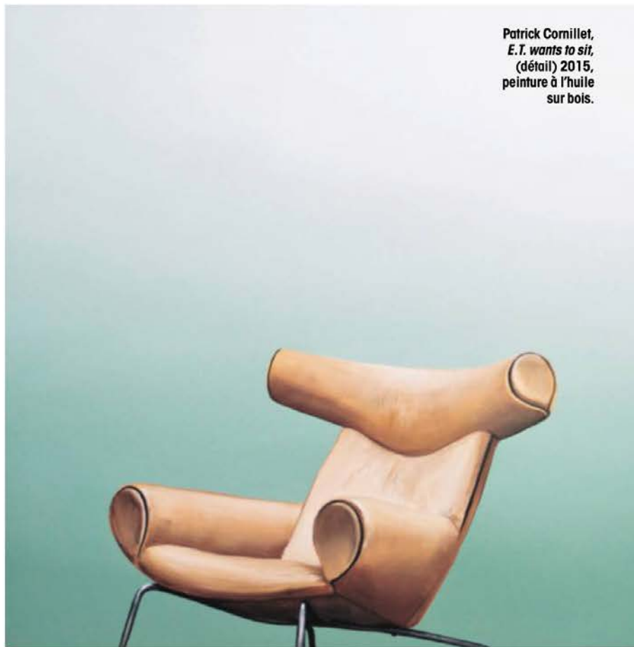
Patrick Cornillet, E.T. wants to sit , (détail) 2015, peinture à l'huile sur bois.