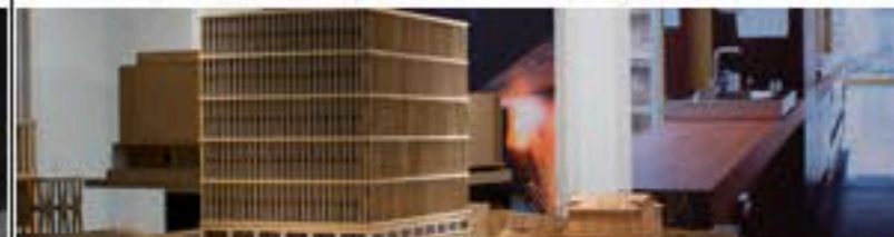
La Galerie d'Architecture