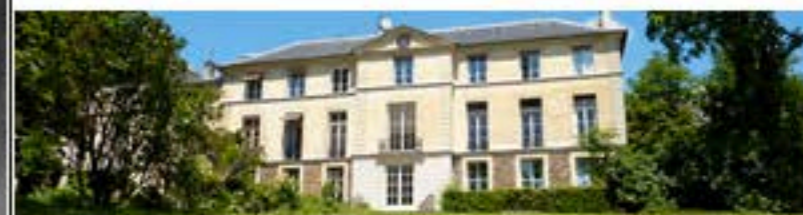
La Maison d'Art Bernard Anthonioz