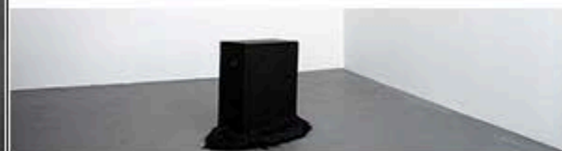
Galerie 22,48 m 2