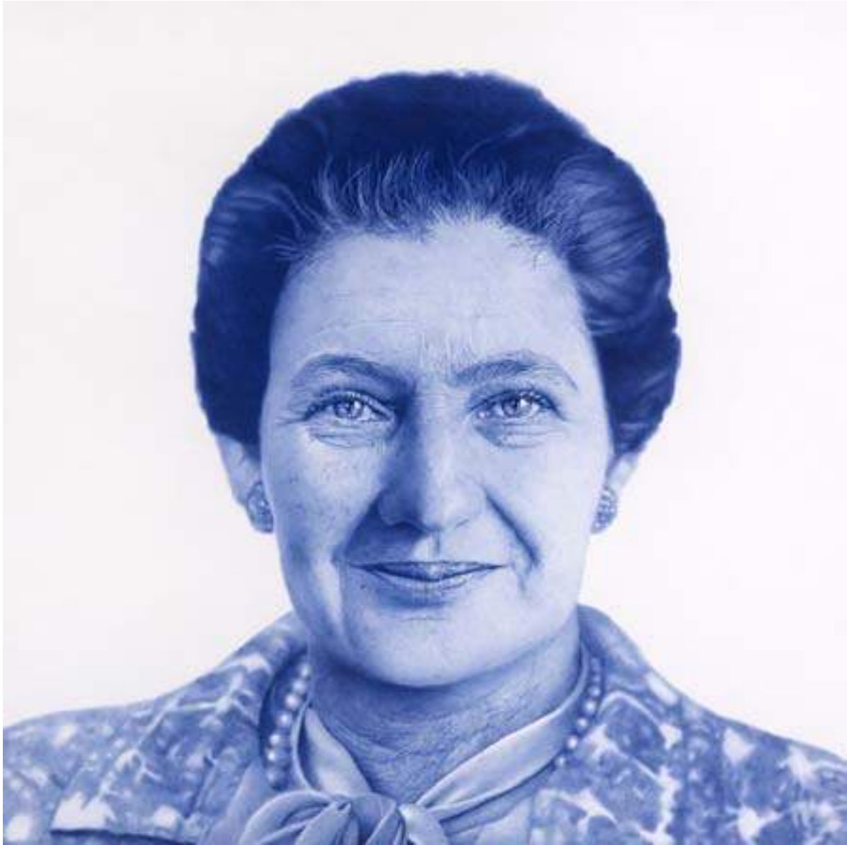
Simone Veil, 2020, stylo à bille sur papier, 100 x 100 cm (collection privée)