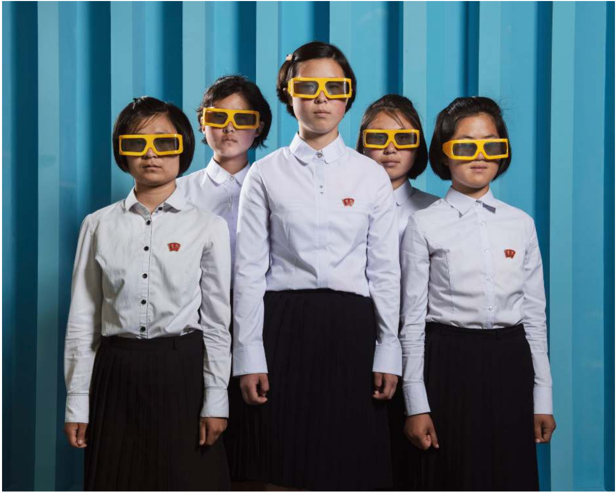
Corée du Nord #112, 2017, Real Portraitik #4, Fine art print sur papier Hahnemühle