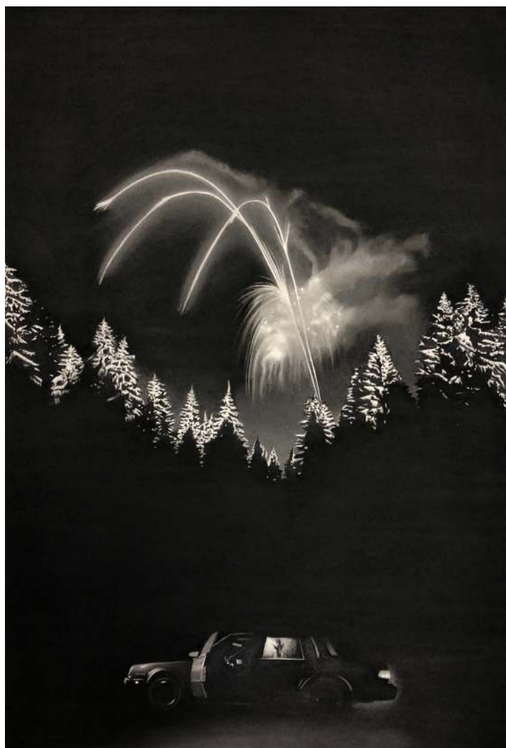
Voiture feu d'artifice, 2019 Dessin à la pierre noire, 98 x 56 cm

Chaque dessin est un exil qui fraye une voie à l'avènement, l'affleurement parfois fugitif d'une immanence. Il expose nos terreurs, nos désirs à la déflagration silencieuse d'une rencontre qui atteint, dans le pli des décombres, un degré précis d'émotion.