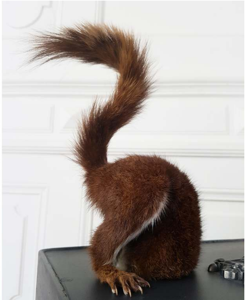
Le casse du siècle, 2018, taxidermie sur coffre acier, laiton, bois, billets de banques, 80 x 50 x 37 cm