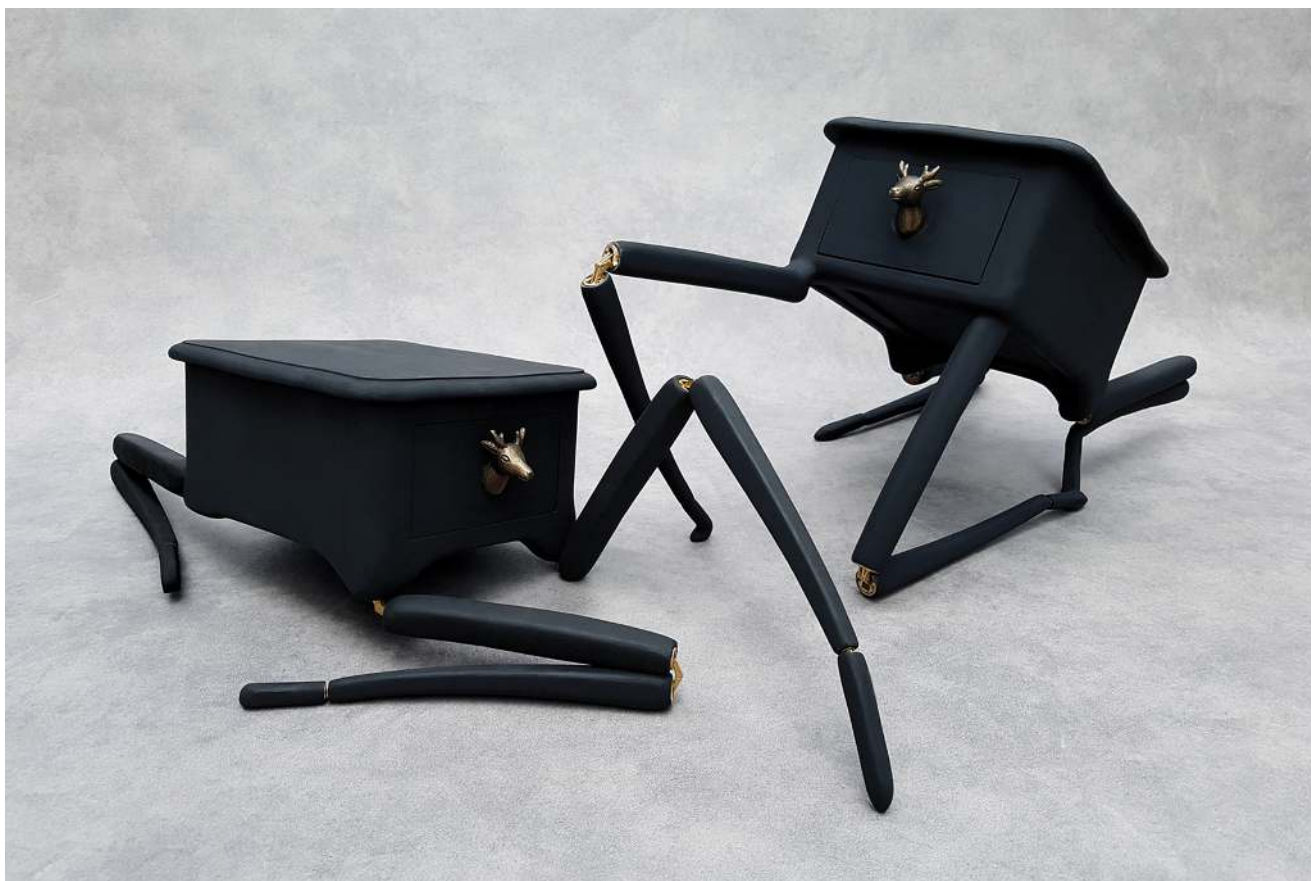
Couple de chevets Louis XV au repos, 2019, bois laqué mat et laiton, 70 x 30 x 33 x 2 cm

Projet Lampyre Voltaire (intervention quartier Voltaire à Lyon 3ème) résidence de la Fête des Lumières, Ville de Lyon. Parcours lumineux ( Superflux Yon ), La Roche sur Yon, galerie Roger Tator