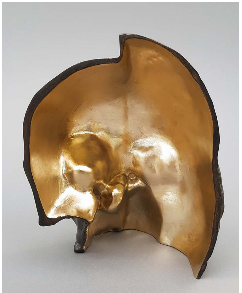
Recto/Verso, 2020 Bronze et or, 30 x 23 x 15 cm